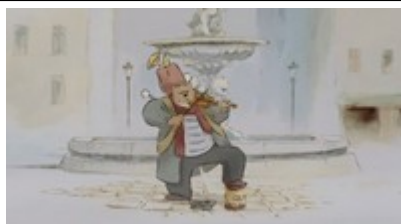
Dans la rue : le violon