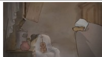
Dans la chambre, sur le fauteuil : le violon