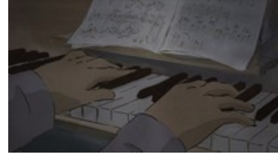
Les mains d'Ernest au piano