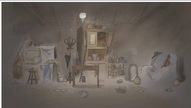
Dans la chambre : une contrebasse, un piano, une trompette, un violon