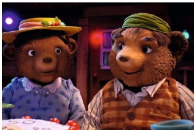
Papa Ours et Maman Ours