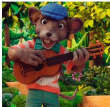
Sam la vadrouille