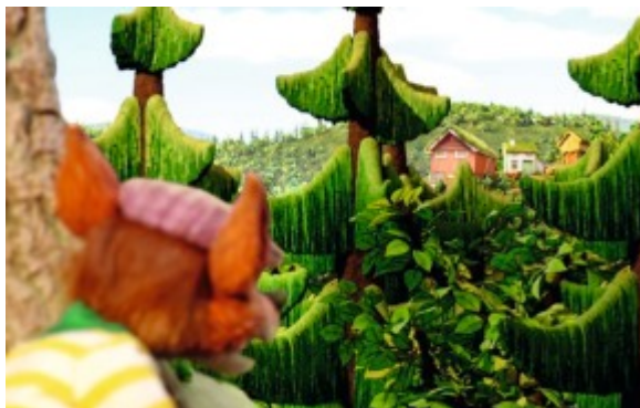
La forêt de Oukybouky