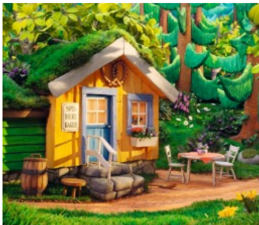
La boulangerie de Maître Lièvre