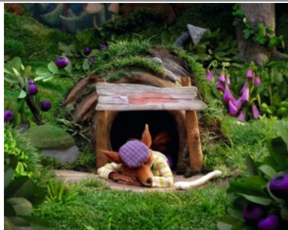
Le repaire de Marvin