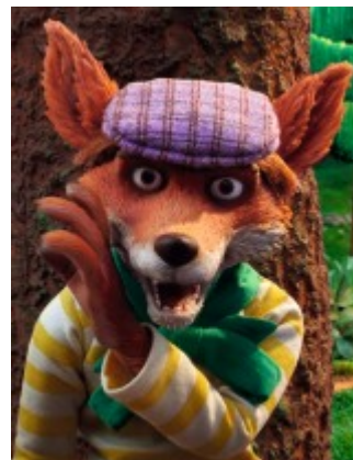
Marvin le renard